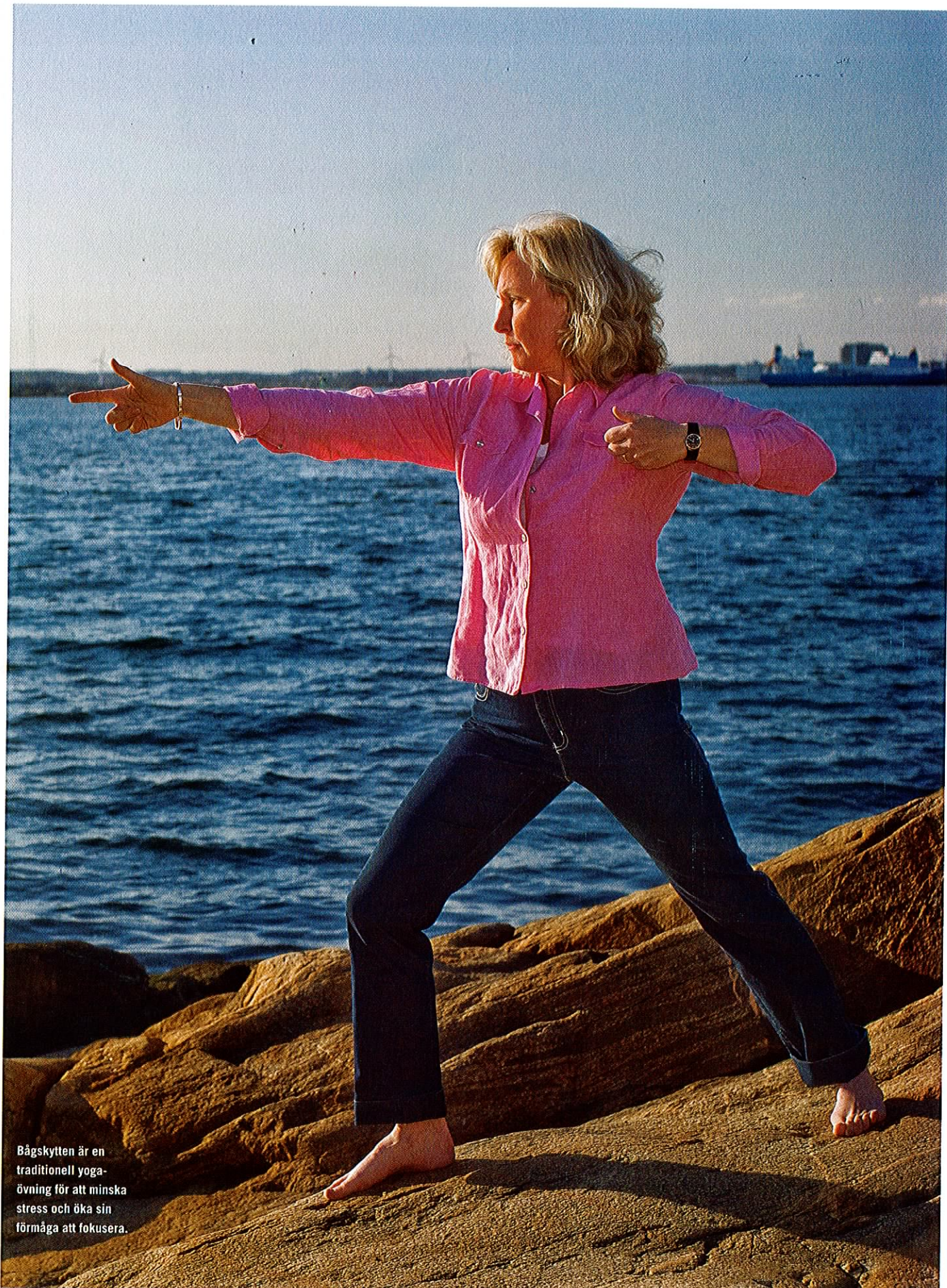
Bågskytten är en traditionell yoga-övning för att minska stress och öka sin förmåga att fokusera.